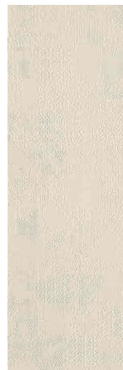
Déchirer XL Gesso * 100-300 cm * 39"-118"

Modello depositato piastrelle n° 001615790-001 – data di deposito: 25/09/2009 Registered design n° 001615790-001 – date of registration: 25/09/2009 Modello depositato piastrelle n° 001615774-001 – data di deposito: 25/09/2009 Registered design n° 001615774-001 – date of registration: 25/09/2009