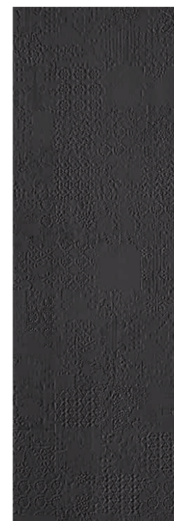
Déchirer XL Grafite * 100-300 cm * 39"-118"