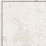
B.H. Anti-Slip Finish

Through-Body Porcelain / Porcelánico Técnico Todo Masa Rectified / Destonified V.2 / Rectificado / Destonificado V.2 N° Designs By Format / N° De Diseños Por Formato : 120x270: 7 / D-90x270: 7 / D-60x120: 14 / 120x120: 14 / 60x120: 14 90x90: 16 / 45x90: 32 / 60x60: 28 / 30x60: 56