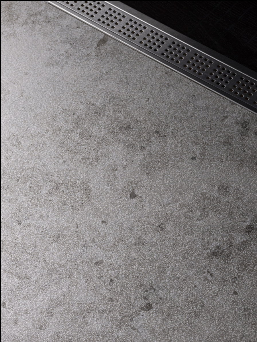
Kendo Grey Bush Hammered Finish