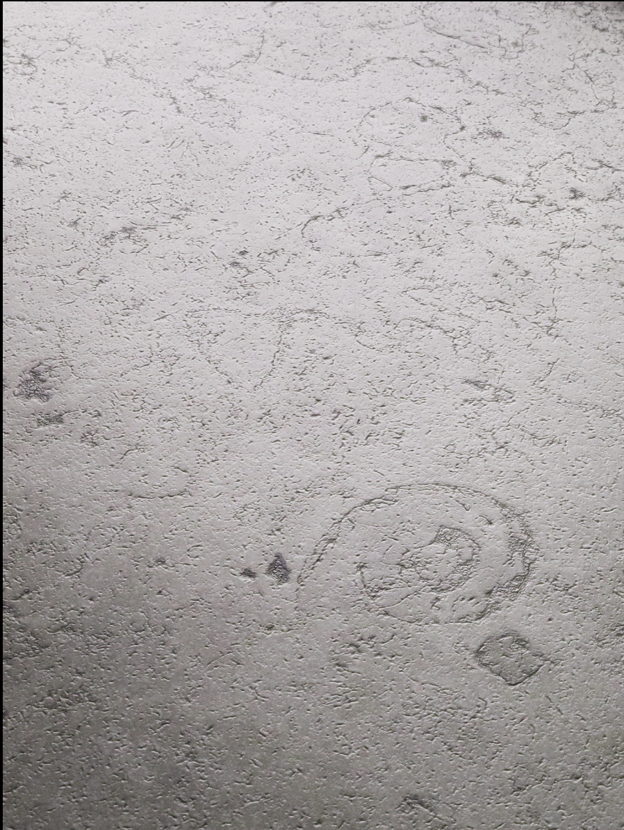
Kendo Light Honed Finish