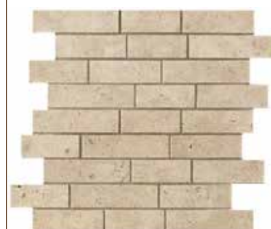
Ever-Claire brick 30x30 - 12"x12"