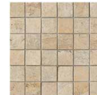
Ever-Doré mosaico 30x30 - 12"x12" formato tessera 5x5 mosaic size 2,5"x2,5"