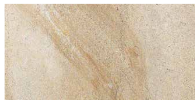
Ever-Doré 30x60 - 12"x24"