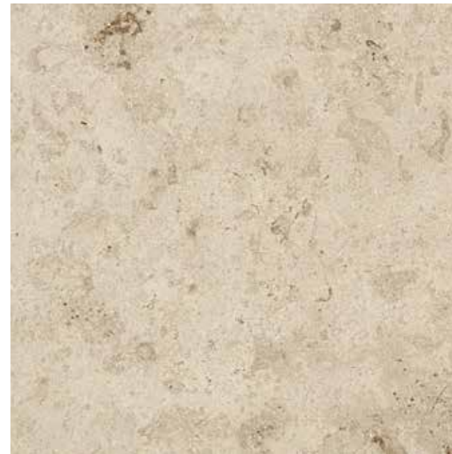
Ever-Beige 60x60 RT - 24"x24"