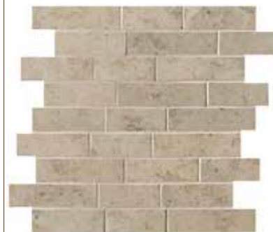
Ever-Grau brick 30x30 - 12"x12"