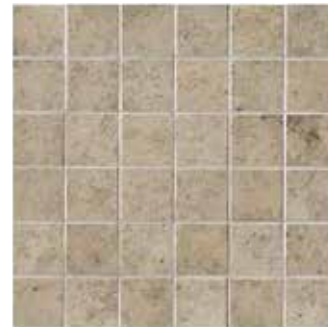
Ever-Grau mosaico 30x30 - 12"x12" formato tessera 5x5 mosaic size 2,5"x2,5"