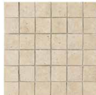
Ever-Claire mosaico 30x30 - 12"x12" formato tessera 5x5 mosaic size 2,5"x2,5"