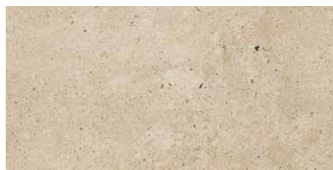
Ever-Claire 30x60 - 12"x24"