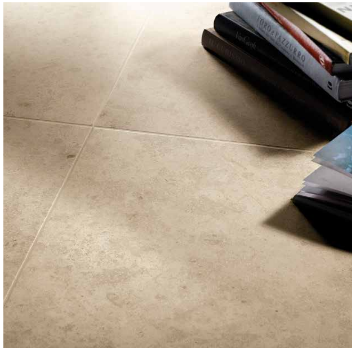
ever-beige 60x60 RT 24"x24"