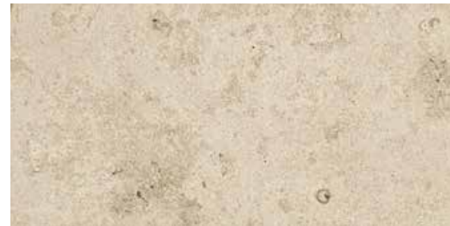
Ever-Beige 30x60 - 12"x24"