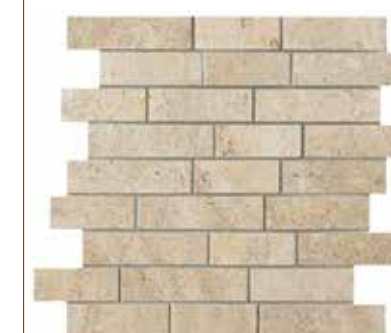
Ever-Doré brick 30x30 - 12"x12"