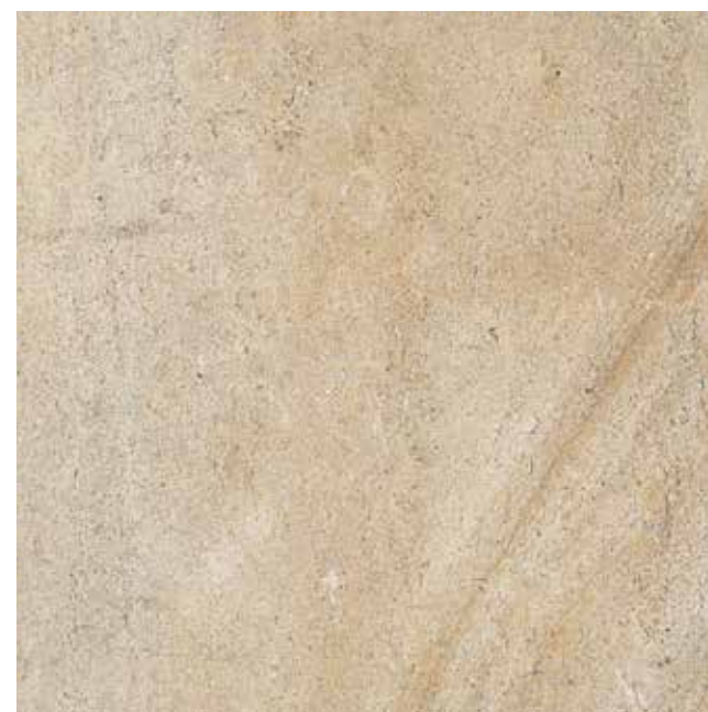
Ever-Doré 60x60 RT - 24"x24"