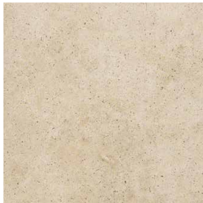
Ever-Claire 60x60 RT - 24"x24"

EN 14411 Allegato G_Piastrelle di ceramica pressate a secco con basso assorbimento d'acqua (E ≤ 0,5%) Gruppo B la UGL (non smaltate, non émaille, unglasierte, unglazed, no esmaltado, Неглазурованные)