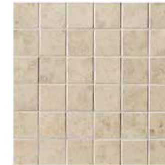
Ever-Beige mosaico 30x30 - 12"x12" formato tessera 5x5 mosaic size 2,5"x2,5"