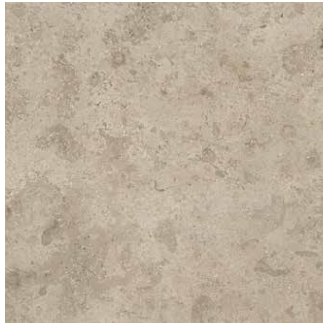
Ever-Grau 60x60 RT - 24"x24"

EN 14411 Allegato G_Piastrelle di ceramica pressate a secco con basso assorbimento d'acqua (E ≤ 0,5%) Gruppo B la UGL (non smaltate, non émaille, unglasierte, unglazed, no esmaltado, Неглазурованные)