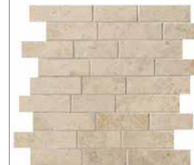
Ever-Beige brick 30x30 - 12"x12"