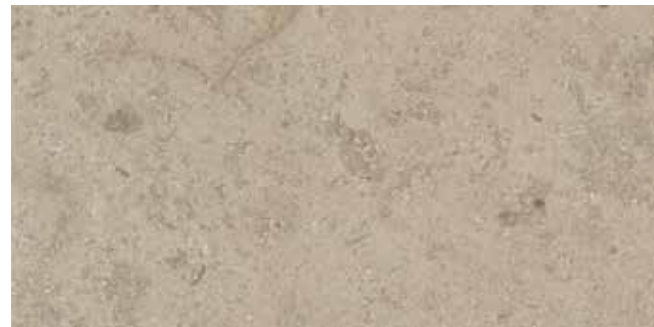
Ever-Grau 30x60 - 12"x24"