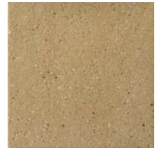
Sahara Sand Rough