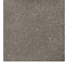
Atlas Brown Rough