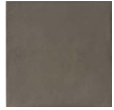
Atlas Brown Smooth