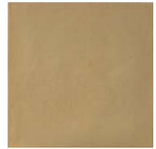
Sahara Sand Smooth