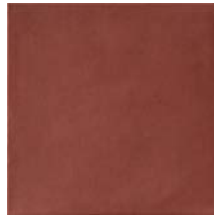
Salta Red Smooth