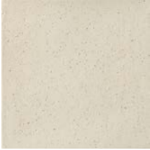
Dover White Rough