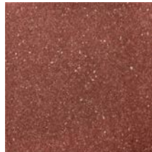
Salta Red Rough