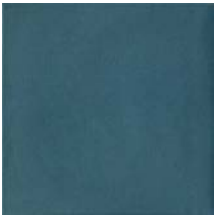
Virginia Blue Smooth