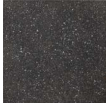
Etna Black Rough