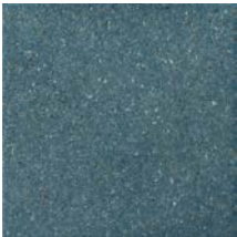
Virginia Blue Rough