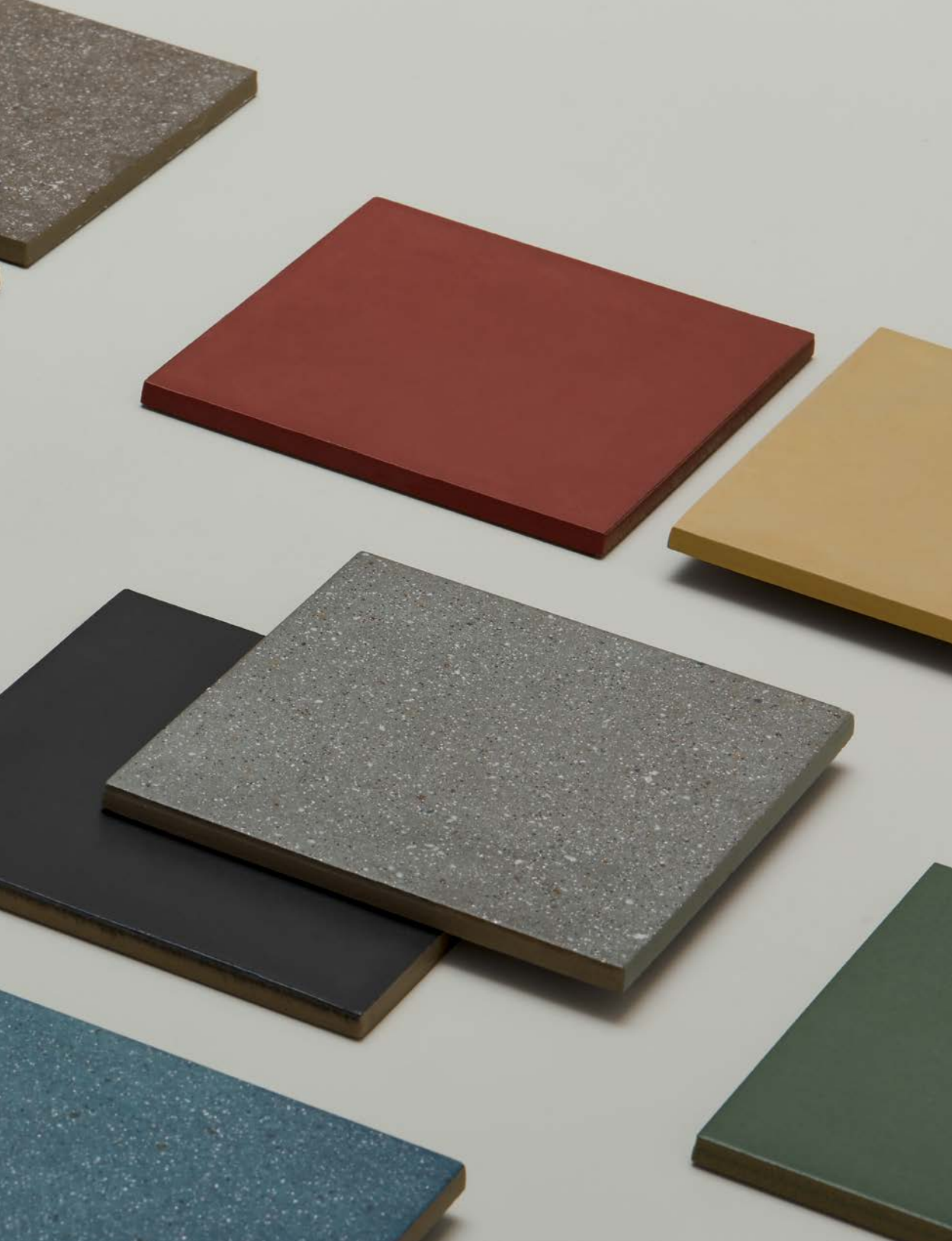
The colour palette features eight shades, inspired by elements of geology, geography, landscape, and place.