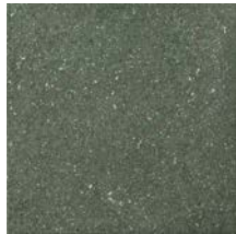
Highland Green Rough