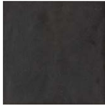
Etna Black Smooth