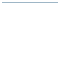
20,5-20,5 cm 8"-8"