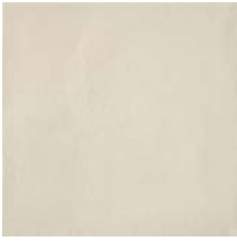
Dover White Smooth