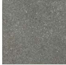
Dakota Grey Rough