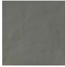
Dakota Grey Smooth